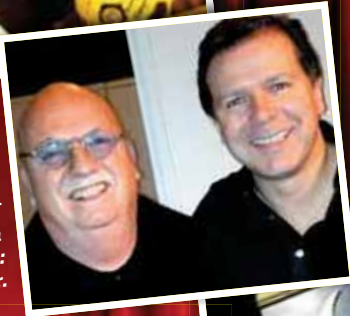
Für viele Fußballfans auf dem grünen Rasen auch mal ein Schauspieler: Andreas Möller.