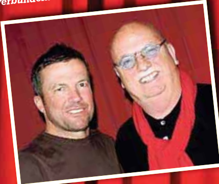
Sky-Fußballexperte und Weltfußballer 1991: Lothar Matthäus.