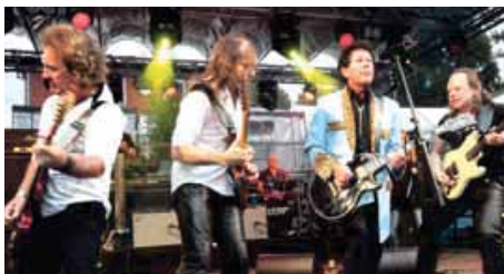
Die Rock Classic Allstars wollen am 27. September das „Wasser im Parkbad zum Kochen bringen“.